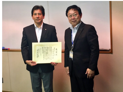
佐々木会長（左）と大八木理事長（右）