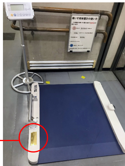
車いすで容易に乗れる測定版