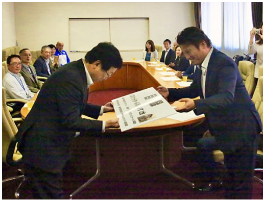
橋本代表取締役(右)から目録の贈呈