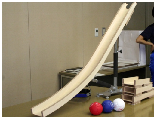
ご寄附いただいたランプ一式