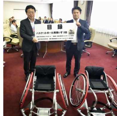
目録を掲げる大八木理事長(左)と橋本代表取締役(右)